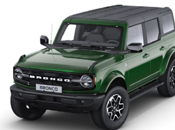
Eruption Green Metallic karosserifarge*