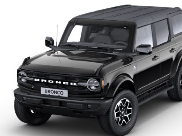
Shadow Black Metallic karosserifarge*