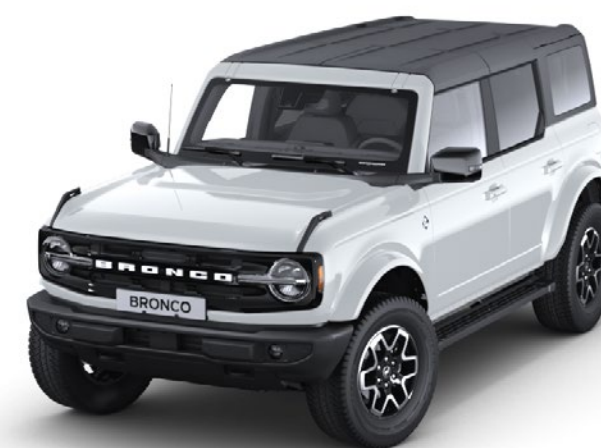
Oxford White Heldekkende karosserifarge