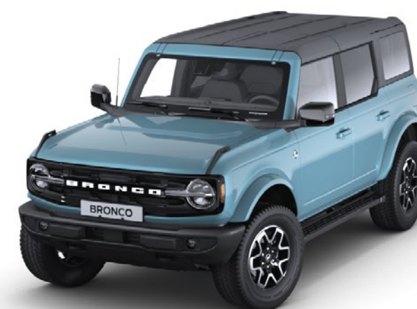
Area 51 Heldekkende karosserifarge*