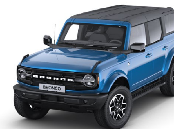
Velocity Blue Metallic karosserifarge*