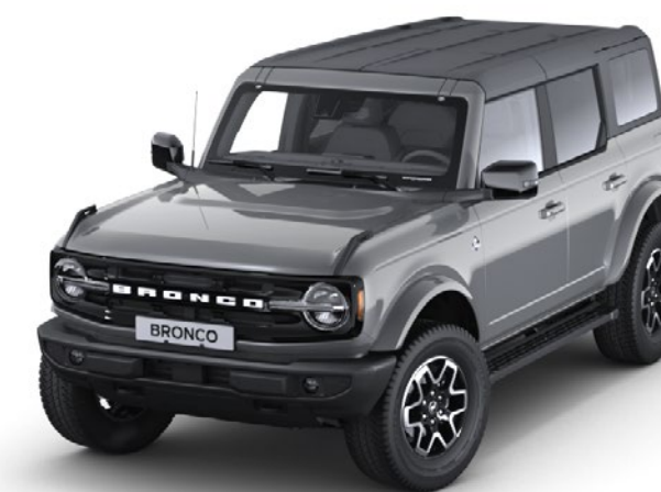
Carbonized Grey Metallic karosserifarge*