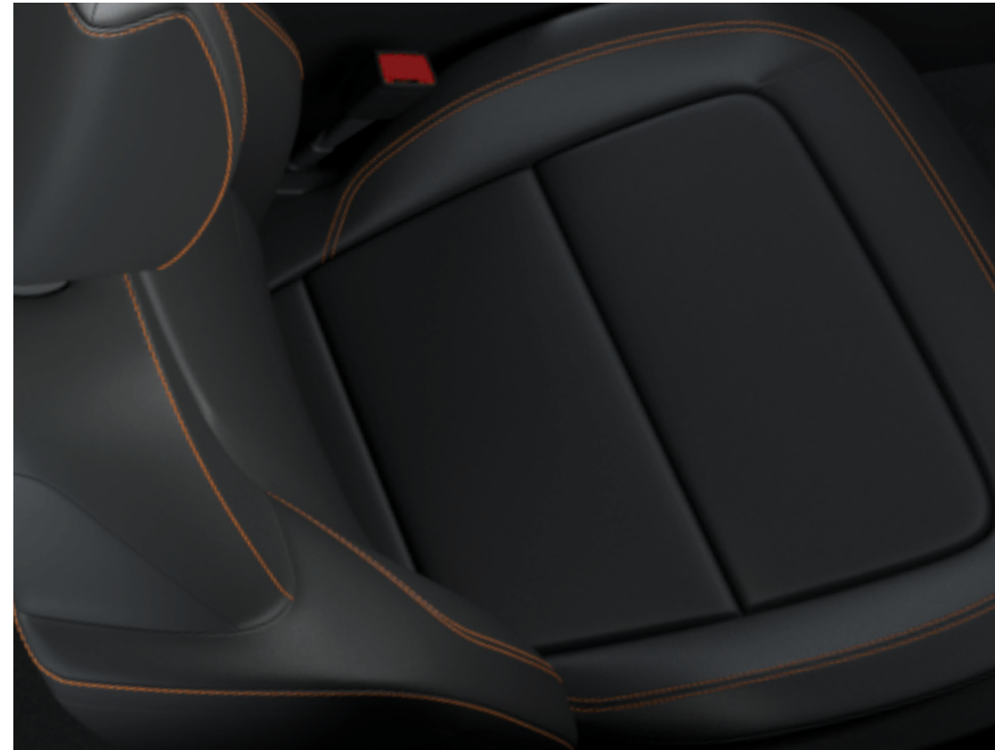
Delvis skinn/vinyl i svart Standard på Badlands