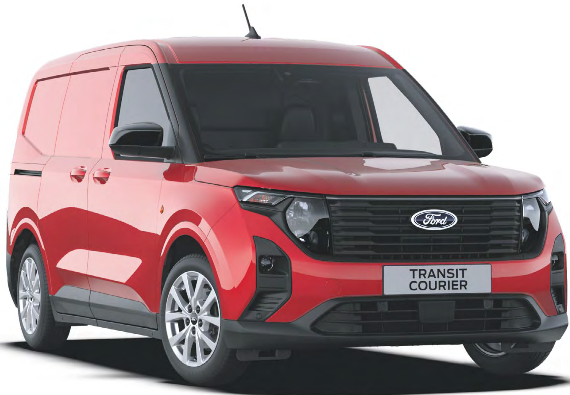
Fantastic Red Metallic*